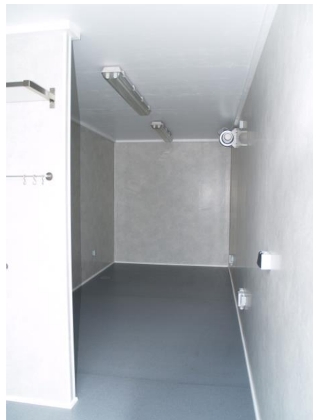
Mobilkøkkenet er indrettet med henblik på installation af kundens egne maskiner.