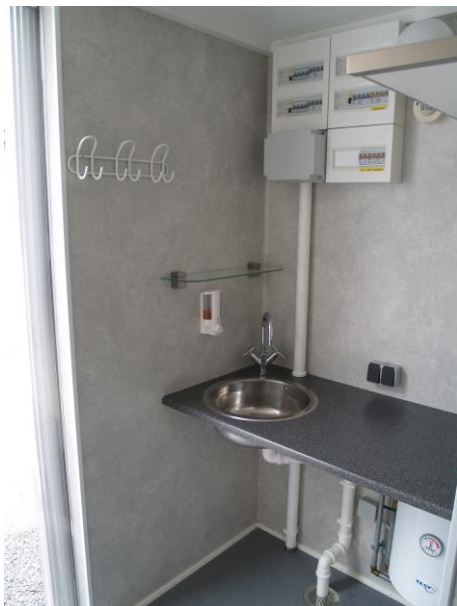
I mobilkøkkenets forreste rum, er placeret en bordplade med håndvask for personlig hygiejne.